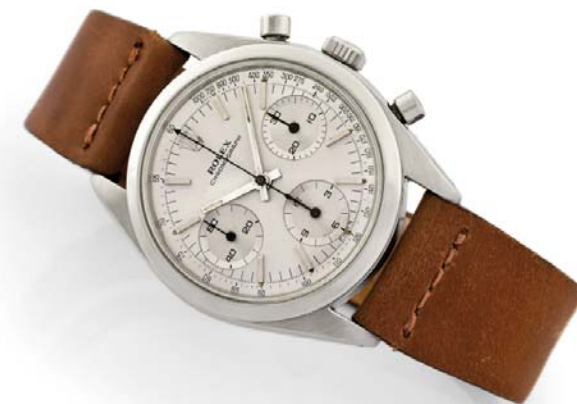
Rolex 6238 pre-Daytona - Questo esemplare è stato venduto a 31250 franchi svizzeri (più di 25.000 €) nel 2012

U no dei fenomeni orologi che maggiormente hanno contribuito al successo di Rolex nel mondo, oltre indiscutibilmente alla miglior politica economico-commerciale, è sicuramente il cronografo Daytona . Snobbato fin dalla nascita, ha incominciato ad essere ricercato, desiderato e pagato oltre il listino solo con l'uscita nel 1987 del modello automatico, il celeberrimo modello 16520 con calibro 4030 di derivazione Zenith. Ripercorrendo la sua storia fin dalle origini, è doveroso citare i modelli 6234/6238 (anche detti Pre-Daytona) che sono i primi modelli ad adottare il calibro Valjoux