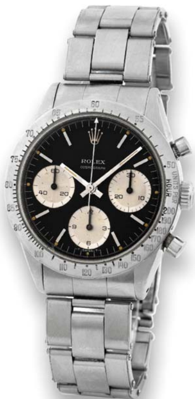
Rolex 6239 Daytona - Prima serie senza la scritta "Daytona" nel quadrante

Circa nel 1969 ecco il primo colpo di scena, l'attore Paul Newman indossa un Rolex Daytona con quadrante esotico (quadrante che prenderà poi il nome dell'attore stesso) per le riprese del suo film " winning ", film di cui una copia originale costituisce un vero e proprio oggetto di culto essendo ricercatissima e pagatissima dai collezionisti. In quegli anni un Daytona costava relativamente poco, circa 150.000 lire per il modello in acciaio, molto meno di un gmt master o di un day date che negli anni 70, grazie al boom economico, era sicuramente l'oggetto del desiderio per quasi tutti gli uomini che desideravano mostrarsi con stile ostentando al polso un amabile lingotto d'oro 18kt. E proprio il costo relativamente basso, unitamente al meccanismo da caricare manualmente ogni giorno furono la causa del flop commerciale (i Daytona venivano proposti con forti sconti e restavano comunque sugli scaffali, e proprio grazie a questo oggi sono diventati un vero e proprio oggetto di culto!). Il Daytona a carica manuale viene