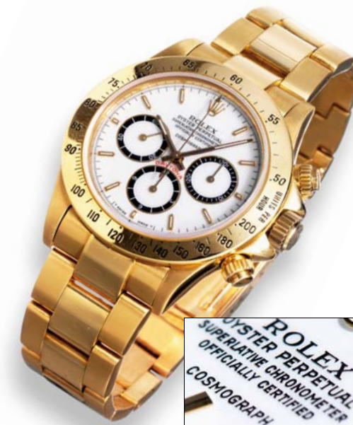
Rolex 16528 - La versione più rara con calibro 4030, con quadrante "floating" o "porcellanato", le scritte sembrano essere sospese nel quadrante

Quindi, spulciando tra i vostri cassetti, se tra le eredità di famiglia avete un orologio che porta tale nome, avete ottime possibilità di aver trovato un piccolo tesoro (oltre sicuramente alla possibilità di indossare un pezzo di storia ).