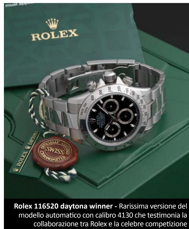
Rolex 116520 daytona winner - Rarissima versione del modello automatico con calibro 4130 che testimonia la collaborazione tra Rolex e la celebre competizione