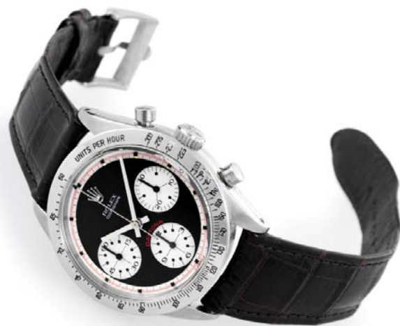
Rolex 6239 Daytona Paul Newman Che la storia abbia inizio!

Circa nel 1969 ecco il primo colpo di scena, l'attore Paul Newman indossa un Rolex Daytona con quadrante esotico (quadrante che prenderà poi il nome dell'attore stesso) per le riprese del suo film " winning ", film di cui una copia originale costituisce un vero e proprio oggetto di culto essendo ricercatissima e pagatissima dai collezionisti. In quegli anni un Daytona costava relativamente poco, circa 150.000 lire per il modello in acciaio, molto meno di un gmt master o di un day date che negli anni 70, grazie al boom economico, era sicuramente l'oggetto del desiderio per quasi tutti gli uomini che desideravano mostrarsi con stile ostentando al polso un amabile lingotto d'oro 18kt. E proprio il costo relativamente basso, unitamente al meccanismo da caricare manualmente ogni giorno furono la causa del flop commerciale (i Daytona venivano proposti con forti sconti e restavano comunque sugli scaffali, e proprio grazie a questo oggi sono diventati un vero e proprio oggetto di culto!). Il Daytona a carica manuale viene